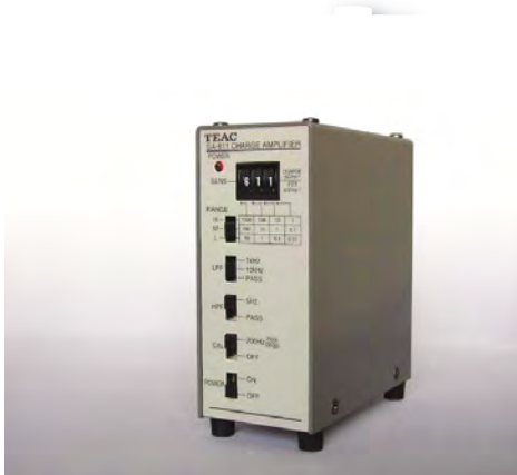
600/700シリーズ用 圧電型加速度トランスデューサー用アンプ