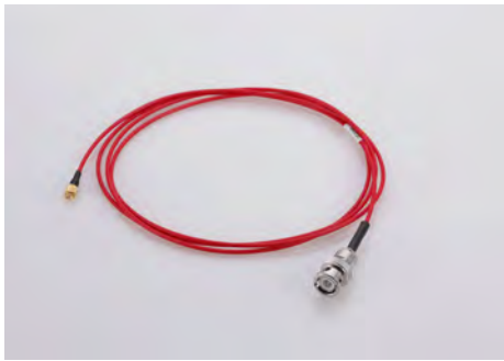
ローノイズケーブル CL-206B(BNC)