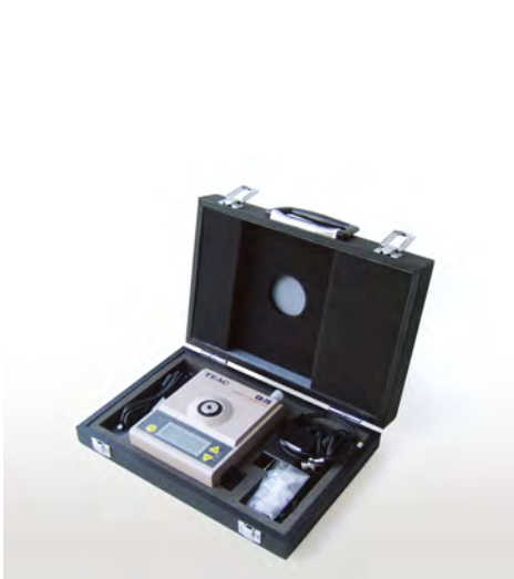
ハンディキャリアプレータ

圧電型加速度トランスデューサーをはじめとする、電荷出力型トランスデューサー用のチャージアンプと、電圧出力型トランスデューサーに内蔵のプリアンプを駆動させる定電流電源を備えています。コンパクト・軽量で、しかも電源は、乾電池、外部DC電源およびAC電源(ACアダプタ使用・オプション)の3系統を有し、屋外での使用にも便利です。