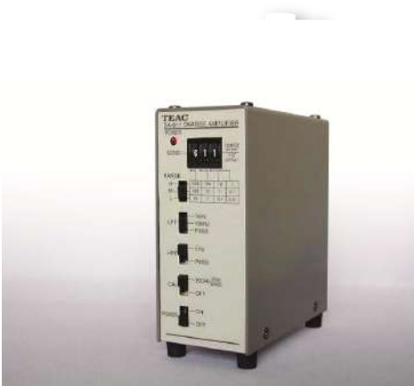
600/700シリーズ用 圧電型加速度トランスデューサー用アンプ