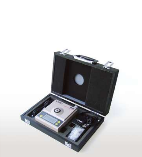
ハンディキャリブレータ

圧電型加速度トランスデューサーをはじめとする、電荷出力型トランスデューサー用のチャージアンプと、電圧出力型トランスデューサーに内蔵のプリアンプを駆動させる定電流電源を備えています。コンパクト・軽量で、しかも電源は、乾電池、外部DC電源およびAC電源(ACアダプタ使用・オプション)の3系統を有し、屋外での使用にも便利です。