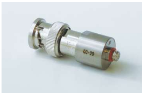
チャージコンバータユニット