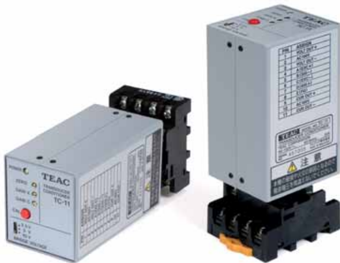
TC-11AC (AC電源仕様) 36,750円 (税抜 35,000円) TC-11DC (DC電源仕様) 36,750円 (税抜 35,000円) [オプション] ローパスフィルタ変更 5,250円 (税抜 5,000円) [オプション] 較正值変更 5,250円 (税抜 5,000円)